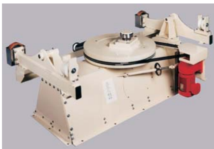
Нижняя часть привода