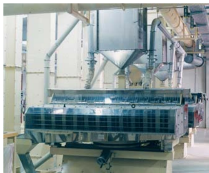
Падди-машина ШУЛЕ на рисозаводе в Греции